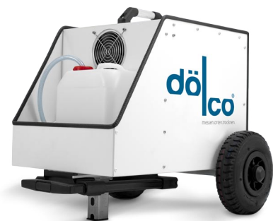
DÖLCO®- VMD Unter-/Überdruck Trocknungsaggregat mit integrierter vollautomatischer Hochdruckdüsendesinfektion.