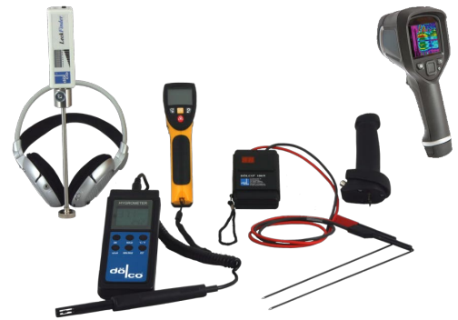
LeckFinder mit Elektroakustik, Luftfeuchte und Taupunkt-messgerät, Infrarotthermomessgerät, Baufeuchtemessgerät mit Tiefensonden und Oberflächensonde, Thermografiekamera

Im Falle von länger stehendem Wasser in der Dämmschicht oder beim Austritt von Fäkalien in die Dämmschicht ist eine Spülung und Desinfektion zum Abtöten von Pilzen, Keimen und Gerüchen notwendig. Wir führen Spülungen und spezielle Hochdruckdüsendesinfektionen in den Dämmschichten durch. Wir empfehlen die Desinfektion in den meisten Fällen, um die Risiken späterer Schäden durch Schimmel für Sie ausschließen zu können.